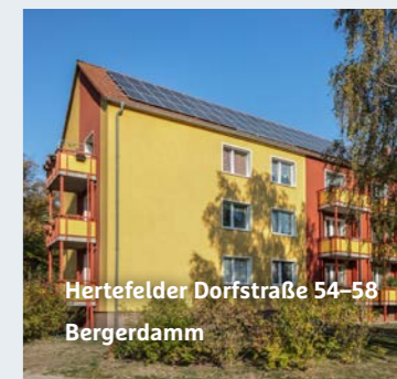
Hertfelder Dorfstraße 54-58 Bergerdamm