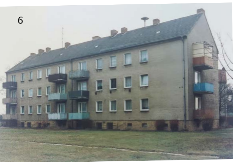
Th.-Fontane-Straße 5 A-B, Ketzin/Havel