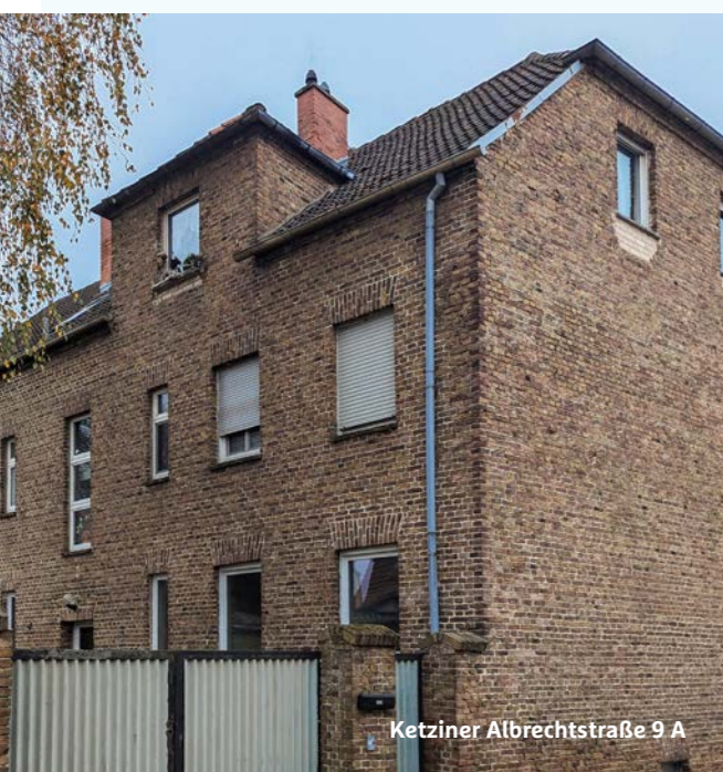
Ketziner Albrechtstraße 9 A