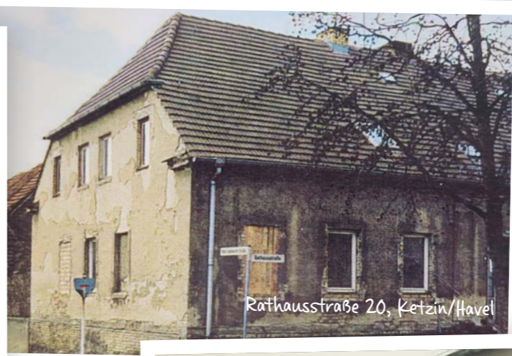
Rathausstraße 20, Ketzin/Havel