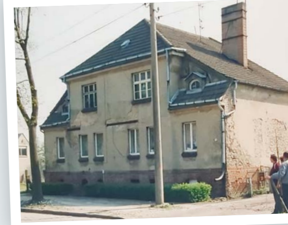
Fr.-Rumpf-Straße 32, Wustermark