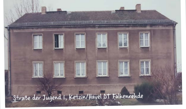
Straße der Jugend I, Ketzin/Havel OT Falkenrehde