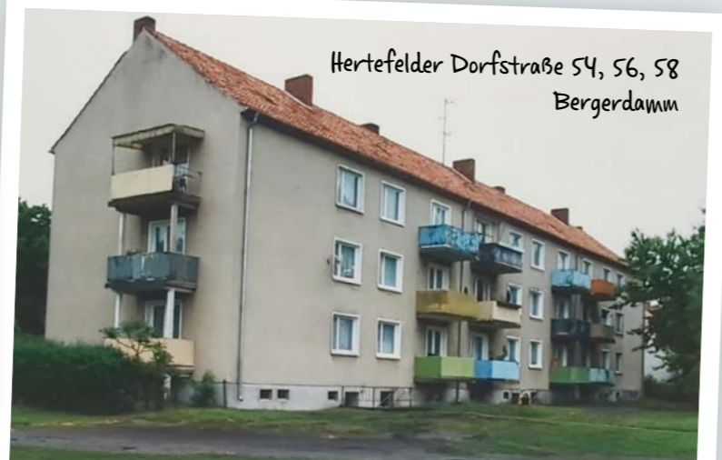
Hertfelder Dorfstraße 54, 56, 58 Bergerdamm