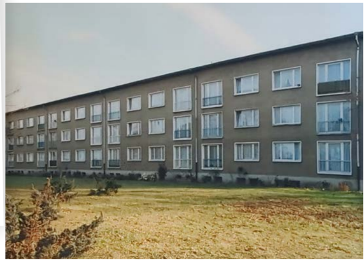
Straße der Neubauten I A-D, Markee