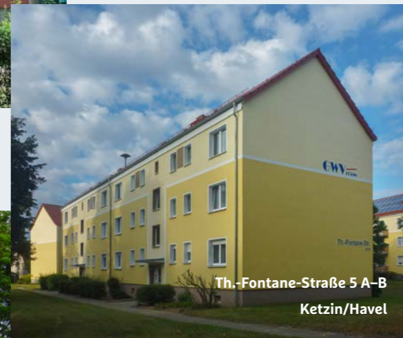
Th.-Fontane-Straße 5 A-B Ketzin/Havel