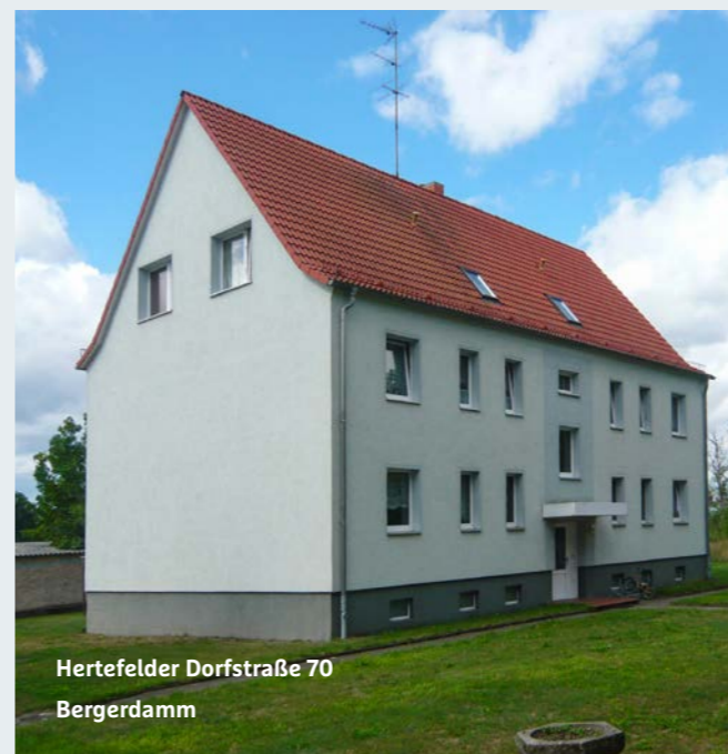
Hertfelder Dorfstraße 70 Bergerdamm