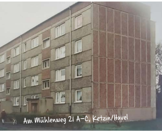
Am Mühlweg 21 A-C, Ketzin/Havel