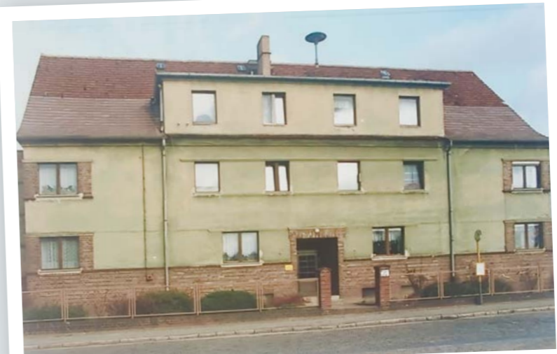
Potsdamer Straße 12 A, Ketzin/Havel