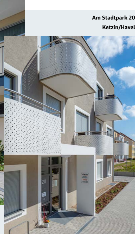
Am Stadtpark 20 Ketzin/Havel