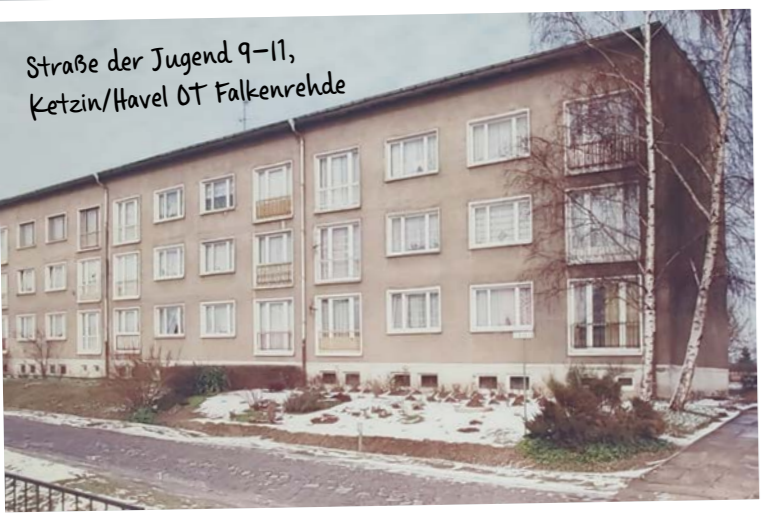
Straße der Jugend 9-11, Ketzin/Havel OT Falkenrehde