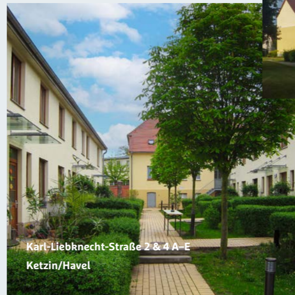
Karl-Liebknecht-Straße 2 & 4 A-E Ketzin/Havel