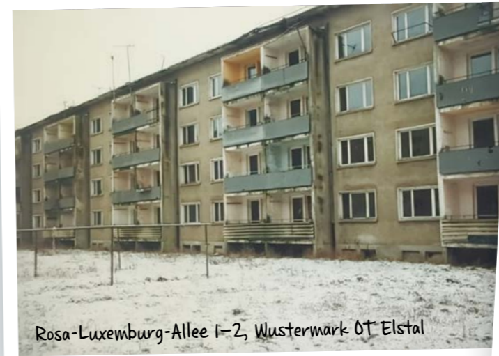
Rosa-Luxemburg-Allee 1-2, Wustermark OT Elstal