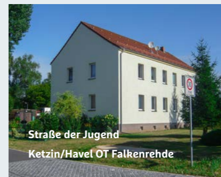
Straße der Jugend Ketzin/Havel OT Falkenrehde