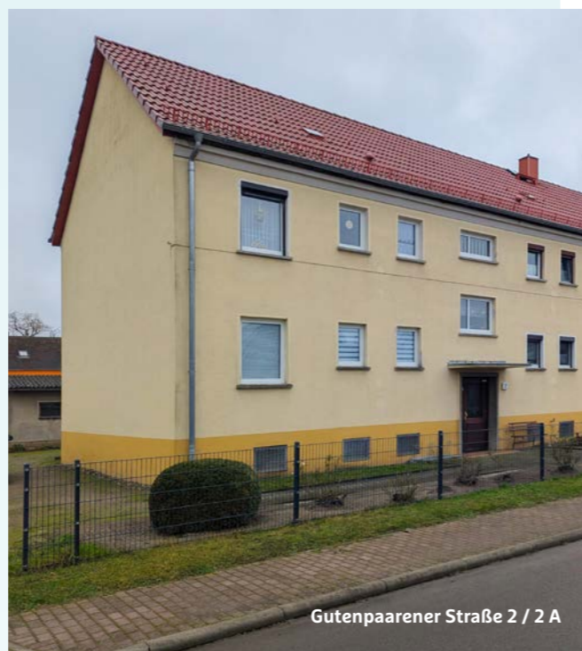
Gutenpaarener Straße 2 / 2 A

Natürlich gibt's auch wieder kleinere Projekte – Reparaturen, Wohnumfeldverschönerungen und alles, was den Wohnalltag ein bisschen angenehmer macht. Wir danken schon jetzt für Ihr Verständnis, wenn es hier und da mal etwas lauter wird – am Ende lohnt es sich für alle!