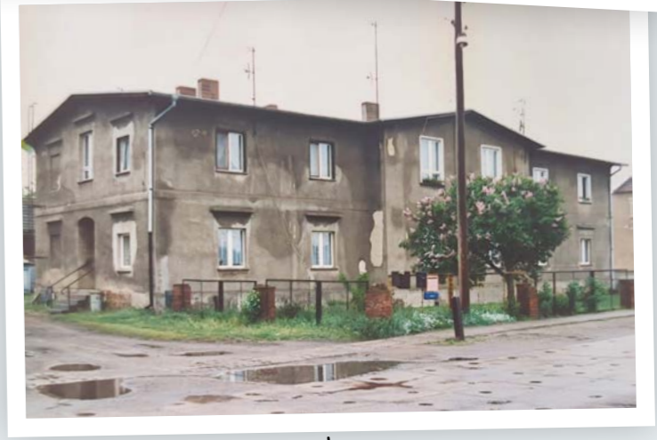
Siedlerstraße 25, 27, 29, Bergerdamm