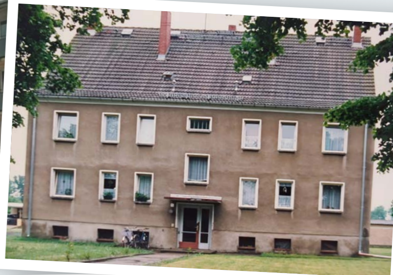
Potsdamer Straße 40, Hoppenrade