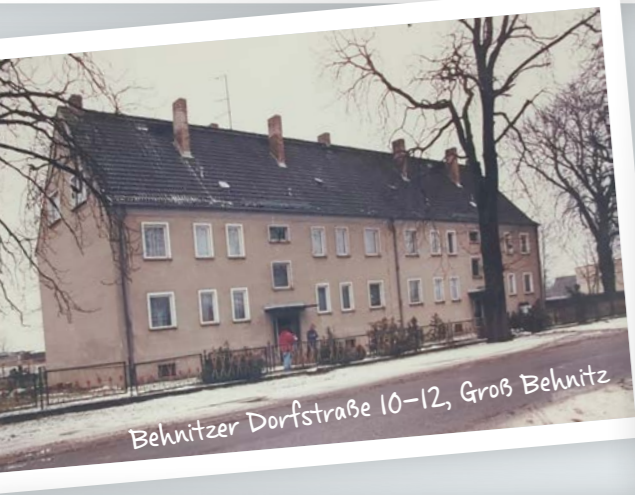
Behnitzer Dorfstraße 10-12, Groß Behnitz