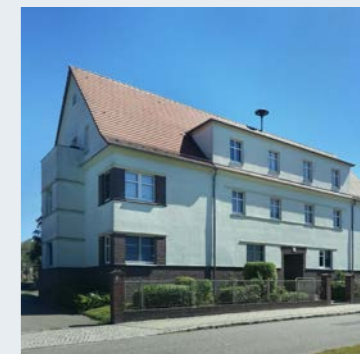
Potsdamer Straße 12 A Ketzin/Havel