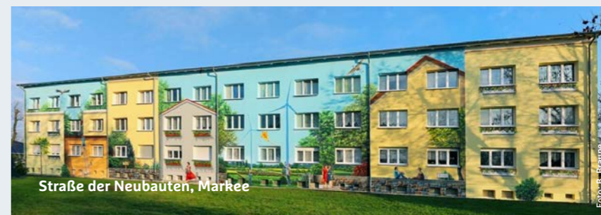
Straße der Neubauten, Märkee