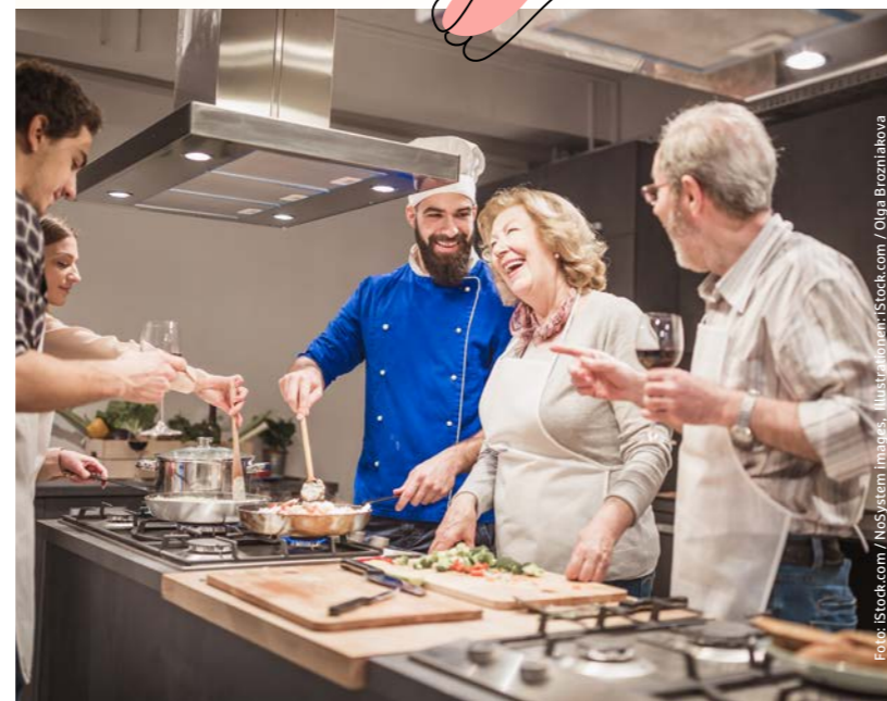
Illustration: iStock.com / Olga Brozhiakova